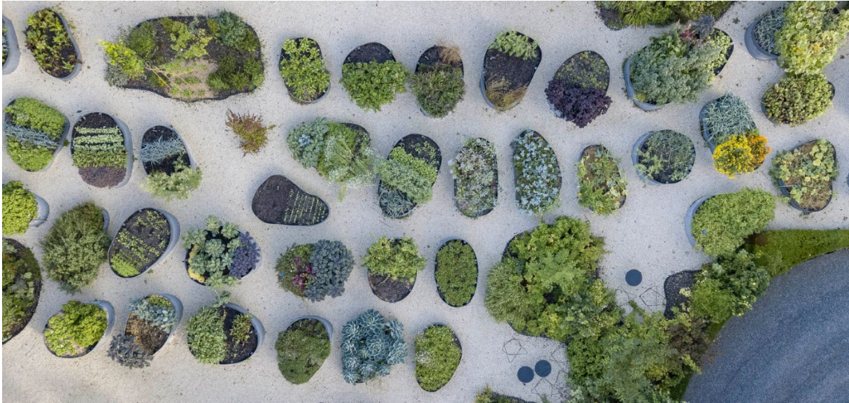
Beeld: Erik Dhont Landscape Architects